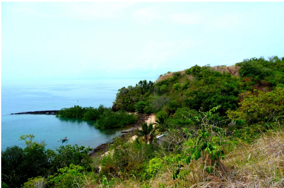
Pierre Huygue

Une bifurcation dans un sentier existant.