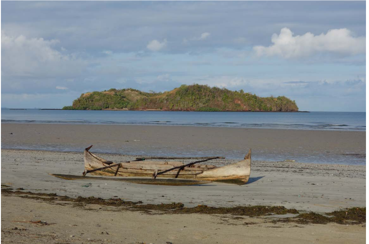
Pirogue © Mathieu Briand