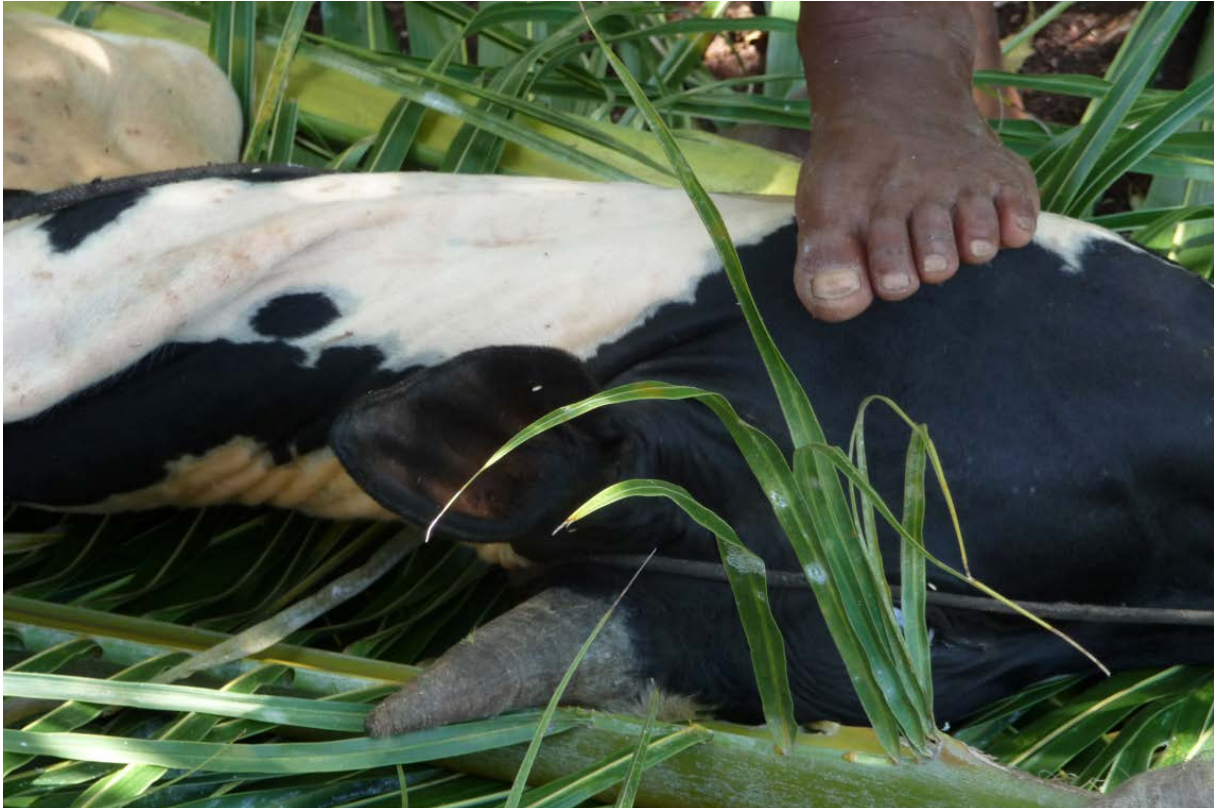
Rituel sur l'île Joro