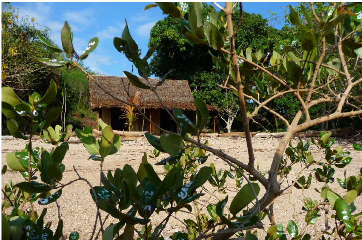
Pierre Huygue © Mathieu Briand