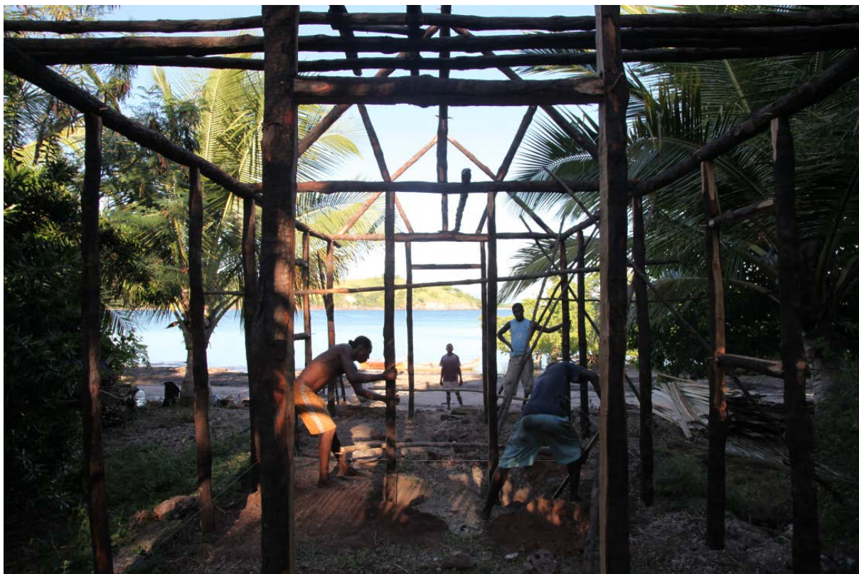
L'atelier © Mathieu Briand