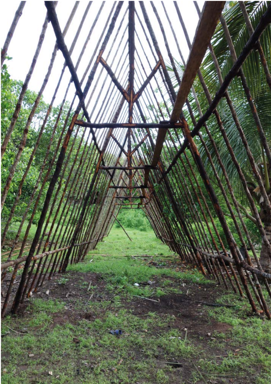
Rudi Ricciotti