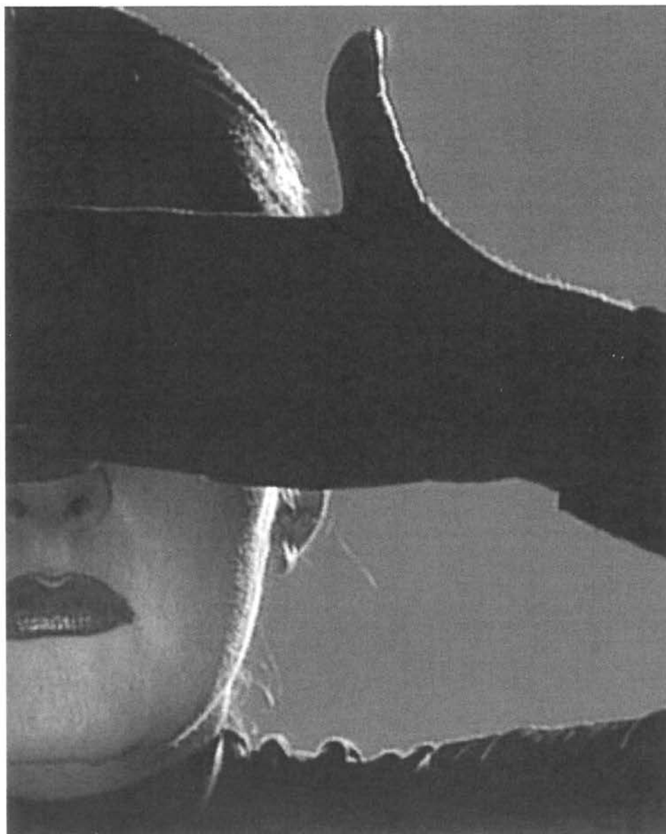
« Lost Souls ». 1997. Vidéo. 8'13". Extrait de « Vidéo Portrait Gallery ».

Je voudrais maintenant aborder cette autre période de formation que fut le séjour qu'Ulay et vous avez effectué parmi le peuple aborigène en Australie. Vous avez également participé à un projet collectif en Micronésie avec John Cage, Daniel Buren et Laurie Anderson (1). Il y avait aussi Brice Marden et Joan Jonas. Mais c'est mon séjour avec les Aborigènes qui a réellement changé ma vie. Comme je l'ai souvent dit dans mes conférences, les Aborigènes sont des êtres humains complets, les plus avancés de la planète. Ils utilisent énormément de facultés du cerveau dont nous n'avons plus idée : la perception extra-sensorielle, la télépathie, etc. Les Tibétains, en comparaison, sont le deuxième peuple le plus avancé de la planète. Ils ont développé des techniques qui les conduiront un jour au même point – mais les Aborigènes y sont déjà. Ces deux cultures ont donc immensément influencé mon travail. Il y a l'idée de vivre dans l'ici et maintenant, de ne rien posséder – les Aborigènes se moquent complètement de posséder des choses. Il y a aussi cette incroyable relation